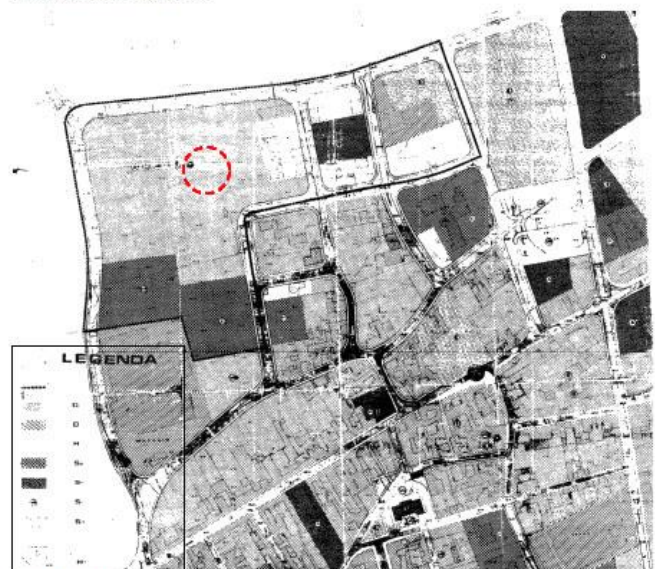
Stralicio tavola PRG