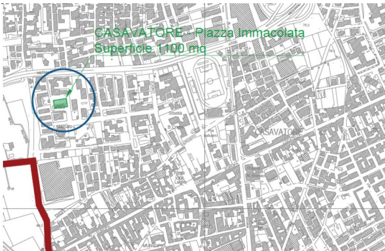
Figura 1. Collocazione territoriale area di intervento

Si riportano di seguito alcune foto aeree per l'individuazione dell'area oggetto dell'intervento.